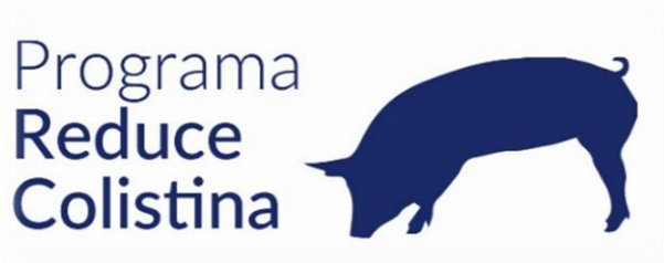
Imagen 1: Logo PROGRAMA REDUCE COLISTINA