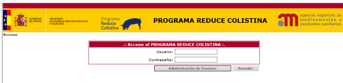
Imagen 2: Aplicación para la declaración de datos - PROGRAMA REDUCE COLISTINA